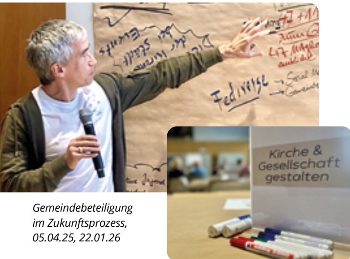
Gemeindebeteiligung im Zukunftsprozess, 05.04.25, 22.01.26