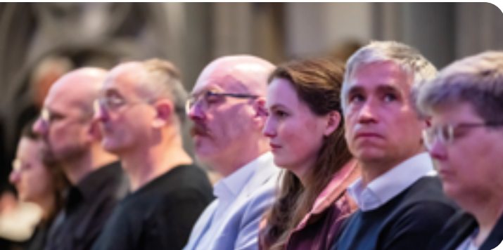
Im Einführungsgottesdienst des Presbyterium, 09.03.25

Ein Einfluss war sicherlich auch die Familie meiner Frau, deren Großvater Pfarrer in der DDR war. Damit verbunden war meine Reflexion über Kirche in Diktaturzeiten, Mauerfall und Wende. Da gab es Menschen,