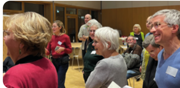
Aktiv beim Zukunftsprozess der Evangelischen Gemeinde Köln

Ja und nein. Mit dem Wort „Ankommen“ fremdle ich ein wenig. Wenn man ankommt, ist man da, am Ziel, fertig – etwas ist abgeschlossen. Für mich ist es eher ein offener Prozess, ein harmonisches und vollständigeres Werden. Es geht darum, gegründet zu sein, Sinn zu finden und Resonanz mit sich selbst zu erleben. Für mich ist das ein Weg, der sich wechselseitig bestärkt: dass man immer klarer spürt, wer man selber ist – und dadurch vielleicht auch die nächsten Schritte geht.