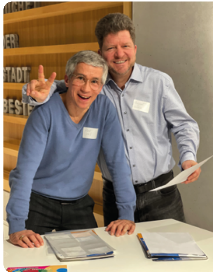
„Suchet der Stadt Bestes“, Auswertung des Beteiligungsworkshops

Ja. Ich glaube zum Beispiel, dass in der globalen, konsumorientierten und digitalen „Alles-ist-möglich-Welt“ manche Menschen inneren Halt suchen. Kirche und Gemeinschaft haben hier viel zu geben. Finden muss man es letztlich selbst – aber Kirche kann ein Raum dafür sein. Wir leben leider in einer Zeit, in der