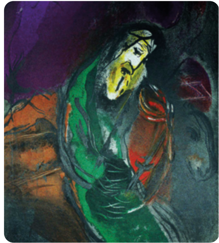
Marc Chagall, Lithographie aus dem Prophetenzyklus, 1956