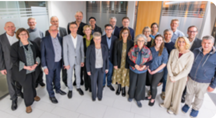
Presbyterium der Evangelischen Gemeinde Köln, 09.03.25

Das passt auch. Ich habe eine sehr tiefe Naturverbundenheit, also auch eine Form von Erdung. Die Räume spielen für mich keine große Rolle: ob das in einem Steingebäude stattfindet oder unter einem Baum. Das ist relevant, aber sekundär. Insofern weiß ich gar nicht, inwieweit dieses Spirituelle und Gläubige schon viel länger da war und nun in eine festere Struktur übersetzt worden ist.